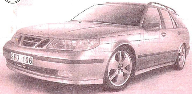
Bildet til høyre illustrerer. Foto: og reg. omk. kommer i tillegg.