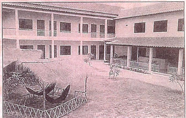
Ekstotisk: I hagen til Earthwalkers hotell i Siem Reap kan du slappe av i hengekayen etter en begivenhetsrik dag.

De to Leknes-guttene forteller at selskapet fremover vil jobbe mot nye målgrupper, som for eksempel skoleklasser som skal på studietur. Hotellet kan også friste med skreddersydde rundturer i Kambodsja.